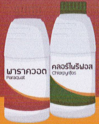
พาราควอต Paraquat